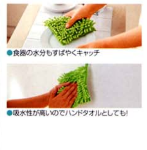
●食器の水分もすばやくキャッチ