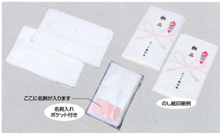
ここに名刺が入ります 名刺入れ ポケット付き

新規版でご注文の方は… ●新規版代¥10,000/1色・印刷代込 ●納期は校了後約15日間 ●のし紙印刷含む